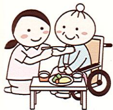
食事介助・服薬介助

入居様がこれまでと変わらない暮らしを継続できるよう、安心して生活いただけるよう支援いたします。きめ細かいサービスと、お一人お一人のご利用者様を親身にケアさせて頂くまごころをモットーに従業員一同努力させて頂く所存でございます。